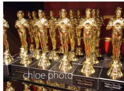
オスカー像 これでアナタもアカデミー賞！